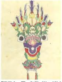
「第三十一圖 矢筈(竹、紙)」