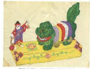
「第十圖 獅子舞(張子)」