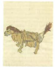
「第四十七圖 藁馬(藁)」