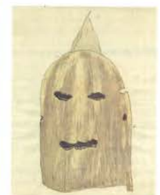
「第四十三圖 假面(竹の皮)」