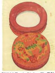
「第三十七圖 パーランクー(竹、紙)」