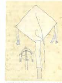
「第四十五圖 凧(紙、竹)」