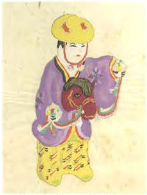
「第三圖 スリ馬踊人形(張子)」