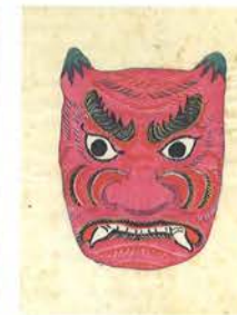
「第四十一圖 假面(張子)」