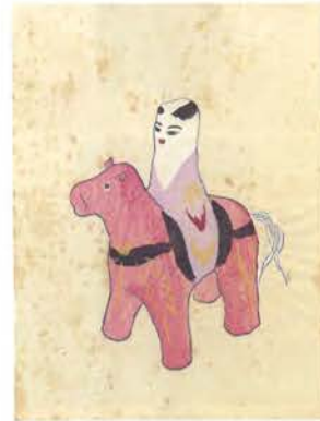
「第六圖 馬乗り(張子)」