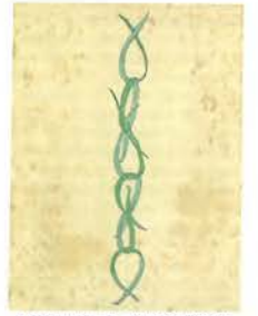
「第五十五圖 鎖(藤葉)」