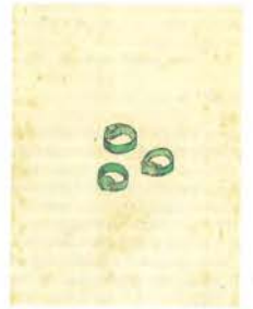
「第五十一圖 指輪(阿旦葉)」