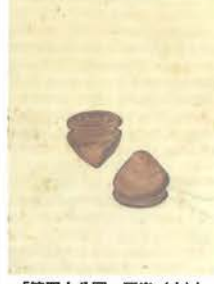
「第四十八圖 獨樂(木)」