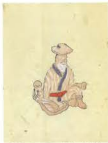
「第二十四圖 釣人(土)」