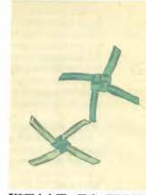
「第四十九圖 風車(阿旦葉)」