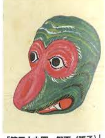
「第三十九圖 假面(張子)」