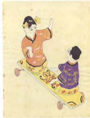
「第四圖 男女踊人形(張子)」