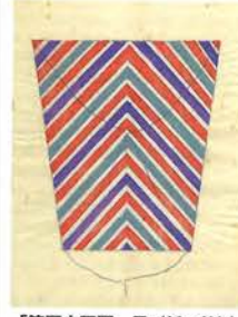
「第四十四圖 凧(紙、竹)」