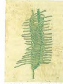
「第五十四圖 箸入れ(藤葉)」