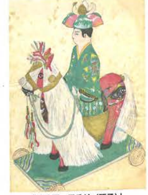
「第八圖 馬乗り(張子)」