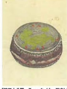
「第三十八圖 テーク(木、紙)」