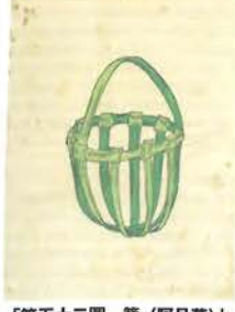
「第五十二圖 籠(阿旦葉)」