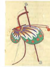
「第四十六圖 フウタン(風箏)(竹、紙)」