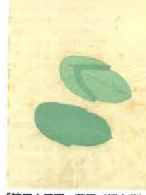
「第五十三圖 草履(福木葉)」