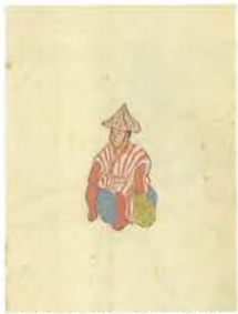
「第二十五圖 釣人(土)」