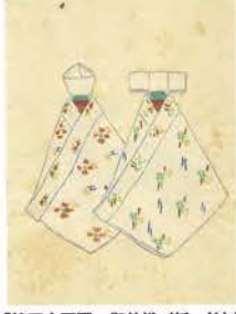
「第三十四圖 御前様(紙、竹)」