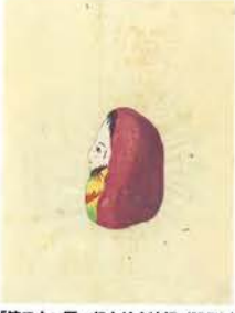
「第二十一圖 起上り小法師(張子)」