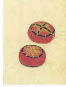
「第三十六圖 ガラ(張子)」