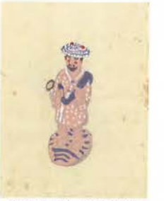
「第二十三圖 漁夫(土)」