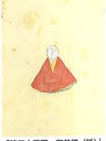
「第三十五圖 御前様(紙)」