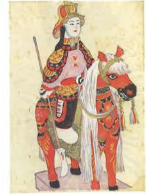
「第七圖 馬乗り(張子)」