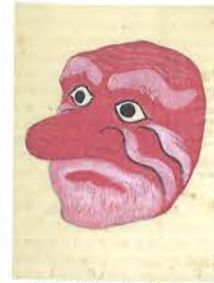
「第四十圖 假面(張子)」