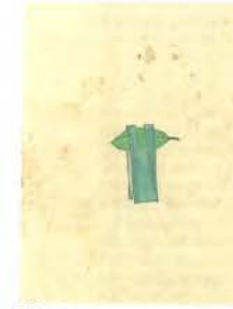
「第五十圖 ビービー(阿旦葉)」