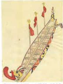
「第二十九圖 龍船(木)」