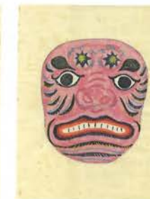
「第四十二圖 假面(張子)」